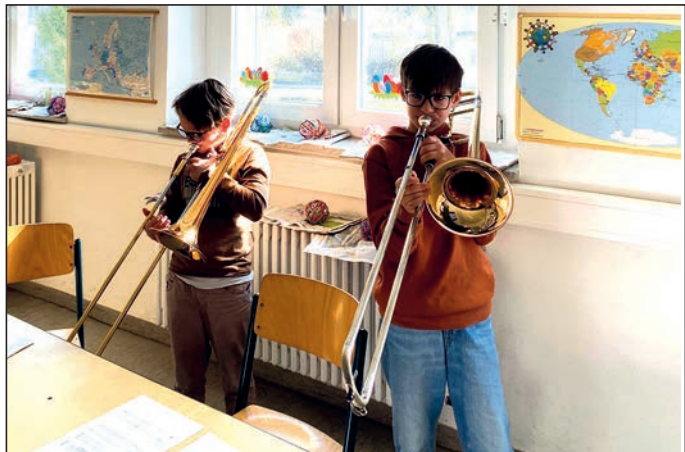
Auch Posaunen kamen beim Musical-Projekt zum Einsatz

Beim Projekt "Wimpelketten" der Klasse 3/4 überlegten die einzelnen Kleingruppen an Tag 1 zuerst einmal, welches Motto sie umsetzen wollten. Danach ging es mit Schere und Dreiecksvorlage ans Schneiden und Bügeln alter Bettlaken. Mit viel Elan wurden anschließend die ersten Dreiecke bemalt. Das Bemalen der Wimpel ging auch noch an Tag zwei weiter, wobei hier die Kinder zwischendurch an der Nähmaschine auf Papierbögen erste Nähversuche machen konnten. Am letzten Tag wurden dann immer zwei Wimpel zusammengenäht, gewendet und teilweise noch mit Buchstaben versehen. Das Zusammennähen zur Kette erledigte in den Ferien dann noch Frau Diem und so werden in Zukunft jahreszeitlich passend Wimpelketten im Schulhaus hängen.