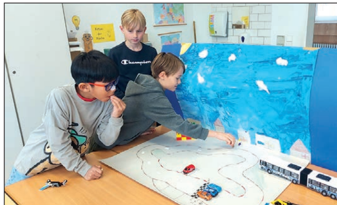
Kinder aus den Klassen 3 und 4 wurden im Projekt „Stop-Motion-Filme“ zu Filmemachern

Im Projekt „Stop-Motion-Filme“ wurden Kinder aus den Klassen 3 und 4 bei Frau Lübche selbst zu kleinen Filmemacherinnen und Filmemachern. Zu Beginn überlegten sie sich spannende Geschichten. Danach gestalteten sie mit viel Kreativität passende Kulissen. Anschließend wurden zahlreiche Fotos von Spielzeugautos und Figuren aufgenommen. Die Kinder veränderten die Szenen Schritt für Schritt. Diese Einzelbilder wurden später zu einem Film zusammengesetzt, sodass die Geschichten lebendig wurden. Zum Abschluss nahmen die Kinder noch passende Geräusche und Dialoge auf, um ihren Filmen den letzten Schliff zu geben. Das Projekt hat allen viel Spaß gemacht und führte zu tollen Ergebnissen, auf die die Kinder sehr stolz sein können.