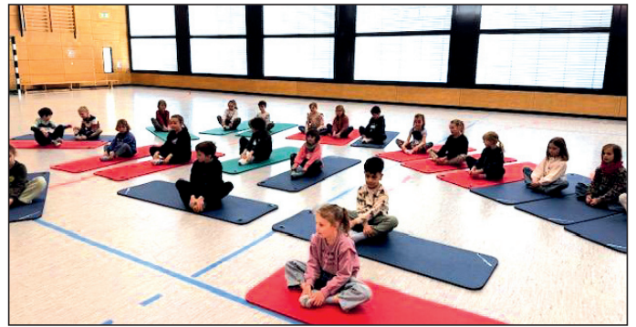
Die Klasse 1 bei ihren täglichen Yoga-Übungen in der Turnhalle