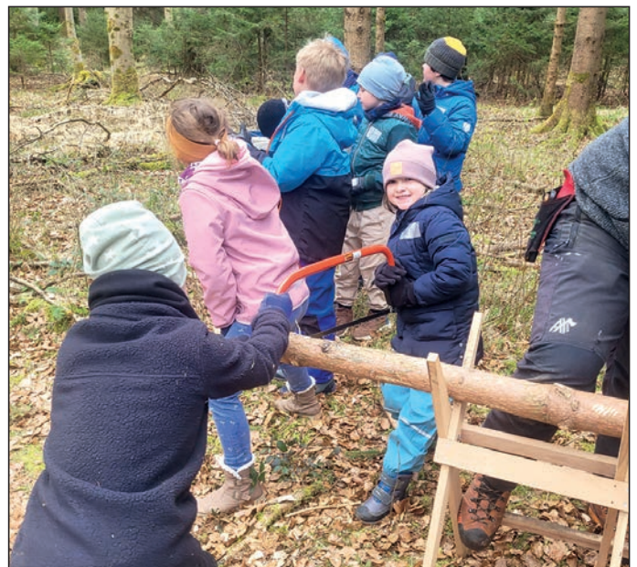
Beim Waldprojekt gab es viele Einblicke in die Natur